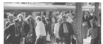
Großgruppen- oder Kleingruppenkarte mit Tageskarte? Wer vier verschiedene Stellen fragt, bekommt fünf verschiedene Auskünfte. Da sage noch einer, der VBB-Tarif sei einfach!