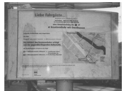
Solche und schlimmere Hinweise fanden sich überall. Da wird an SEV-Haltestellen auf gegenüberliegende Haltestellen verwiesen - oder einfach Null-Information geliefert.