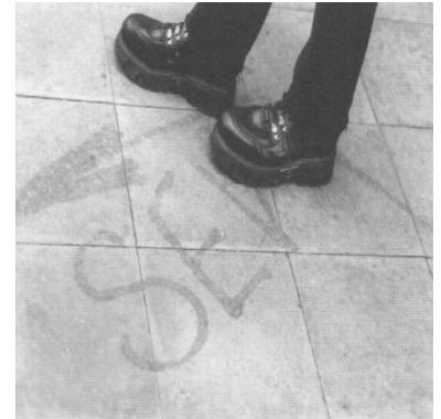
Unkonventionelle Lösungen bei der Fahrgastinformation - besser so, als gar nicht!

Als es am 6. November losging, gab es weder Fahrplanaushänge für die