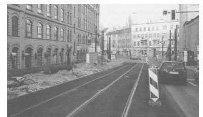
Straßenbahnschleuse ohne Straßenbahnverkehr - aber mit Behinderung der SEV-Busse. (Foto: Matthias Gibtnier, Dezember 2000)