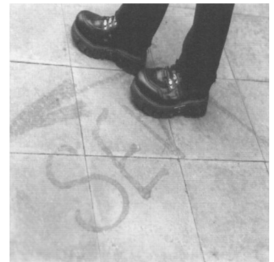
Unkonventionelle Lösungen bei der Fahrgastinformation - besser so, als gar nicht! (Foto: Alexander Frenzel, Dezember 2000)

Als es am 6. November losging, gab es weder Fahrplanaushänge für die