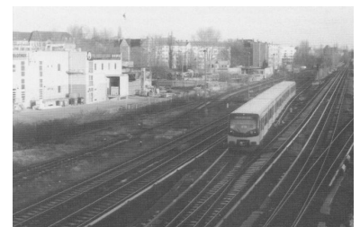
Das Fahren mit Bahn und Bus wird in Berlin einmal wieder teurer. (Foto: Alexander Frenzel, Dezember 2000)