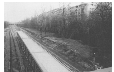
Der S-Bahnhof Kolonnenstraße im Dezember 2000.