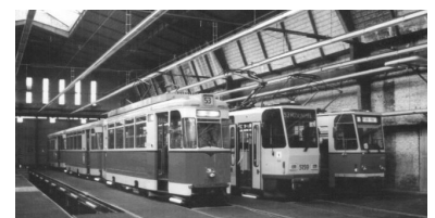
Die Erneuerung des Berliner