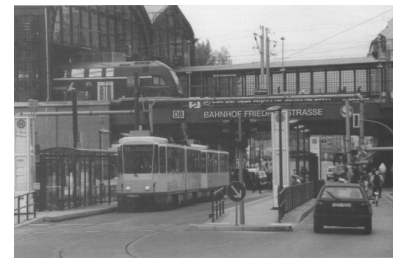
Wiederholt werden die Stammkunden zur Kasse gebeten. Sollen im Durchschnitt die Preise um nur drei Prozent steigen, sind es bei den Monatskarten fünf Prozent. Der Berliner Fahrgastverband IGEB hält diese Steigerungen für fatal. (Foto: Alexander Frenzel, Bahnhof Friedrichstraße, Oktober 2000)

Der Berliner Fahrgastverband IGEB ist skeptisch, ob die neuen Angebote einer Berlin-Card und einer Freizeitkarte nennenswert nachgefragt werden oder gar neue Kunden erschließen. Am ehesten scheinen sie für Senioren interessant, für die es