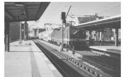
Wie soll Tick.et in der Regionalbahn funktionieren? Darauf haben die Befürworter noch keine Antwort. (Foto: RE am Bahnhof Friedrichstraße, Alexander Frenzel, September 2000)