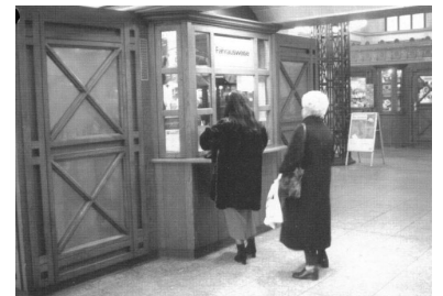
Fahrschalter U-Bahnhof Wittenbergplatz.

Bei den Linienbezeichnungen schafft die BVG das »N« für Nachtlinien ab, während Potsdam und Havelbus (N12, N15, N16, N17, N43) diese Bezeichnung auch weiterhin beibehalten wollen. Auch der VBB-Tarif ist recht undurchschaubar und von einheitlichen Angebot weit entfernt, so gibt es bei mehreren Unternehmen Haustarife mit abweichenden Preisen und Regelungen, der Begriff »Kurzstrecke" wird sehr unterschiedlich definiert und selbst die Betriebe scheinen Schwierigkeiten bei der Interpretation zu haben. Mehrmals hat zum Beispiel DB Regio mit eigenen Angeboten (zum Beispiel Brandenburg-Ticket, 5-Tages-Fahrradkarte, Freizeitkombifahrkarten)