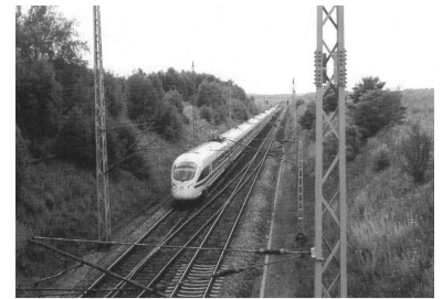
Die Deutsche Bahn AG setzt im Fernverkehr künftig vorrangig auf den ICE. Für die Fahrgäste bedeutet dies allerdings: häufiger umsteigen und höhere Fahrpreise. Aufgenommen wurde der ICE-T auf dem Berliner Außenring. (Foto: Christian Schulz, August 2000)

Eigentümer der Bahn ist zu 100 Prozent der Bund. Für den Schienenverkehr gilt der Verfassungsauftrag gemäß Grundgesetz-Artikel 87e. Deshalb überweist der Bund für Aufgaben des Nahverkehrs zurzeit jährlich etwa 13,4 Milliarden Mark an die Länder. Mit dem Versuch, Fernzüge durch Nahverkehrszüge zu ersetzen, zielt die Bahn auf die - zweckfremde - Verwendung von Nahverkehrsgeldern des Bundes. Sie will eine