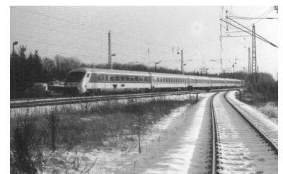
Von den Bahnhöfen seit Jahren vernachlässigt: der Interregio. Im Bild IR 2274 nach Rostock bei der Durchfahrt im Bahnhof Blankenfelde.