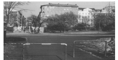
Zukünftige Haltestelle Görlitzer Park. Um dieser Haltestelle ihr sensibles Umfeld einzufügen, sollte ein Wettbewerb ausgeschrieben werden.

- a) Westumfahrung (über Skalitzer Straße, Spreewaldplatz) Die Strecke ist 3,5 Kilometer lang. Mit zehn zusätzlichen Kurven ergibt sich eine Fahrzeit von 15 Minuten.