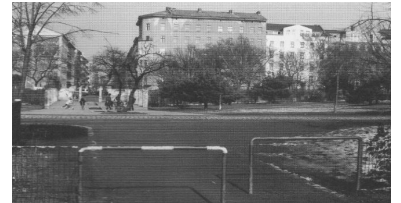
Zukünftige Haltestelle Görlitzer Park. Um dieser Haltestelle ihr sensibles Umfeld einzufügen, sollte ein Wettbewerb ausgeschrieben werden.

- a) Westumfahrung (über Skalitzer Straße, Spreewaldplatz) Die Strecke ist 3,5 Kilometer lang. Mit zehn zusätzlichen Kurven ergibt sich eine Fahrzeit von 15 Minuten.