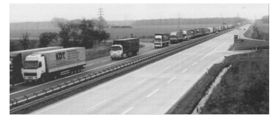
Brummi-Parkplatz Autobahn A12. Der Ausbau von attraktiven KV-Verbindungen zwischen Deutschland und Polen läßt auf sich warten. (Foto: Christian Schultz, März 2001)