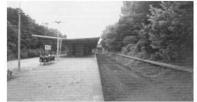
S-Bahnhof Botanischer Garten ohne Gleise. (Foto: Thomas Cibosch, Juni 2001)

© GVE-Verlag / signalarchiv.de - alle Rechte vorbehalten