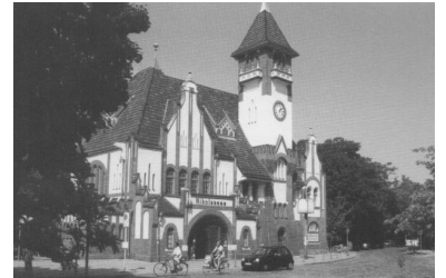
S-Bahnhof Nikolassee: Für den Aufzugseinbau gibt es noch keinen Termin. (Foto: Alexander Frenzel, August 2001)

Wann erhält der umfassend umgebaute S-, Regional- und Fernbahnhof Lichtenberg Aufzüge und eine behindertengerechte Umsteigemöglichkeit zur U-Bahn-Linie 5 und zum Wohngebiet Siegfriedstraße?