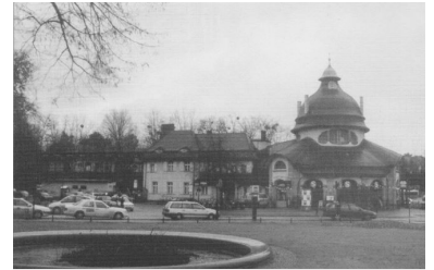
Hier fand der Adventsmarkt statt.

http://signalarchiv.de/Meldungen/10002103 .