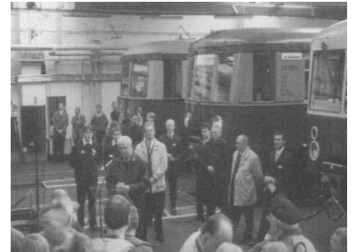
... und bei der Vorstellung in der Betriebswerkstatt Erkner.