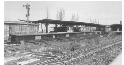
Bahnhof Jungfernheide, etwa Mitte der 70er Jahre. Einst konnte man von hier aus nicht nur auf dem S-Bahn-Ring nach Beusselstraße oder Westend, sondern nach Spandau und Gartenfeld fahren. Ob die beiden letztgenannten Verbindungen jemals wieder durch S-Bahn-Züge befahren werden, ist fraglich.

Im Westen Berlins entstand parallel zur Ringbahn eine Stadtautobahn, deren dichter Autoverkehr heute Unmengen an Abgasen produziert. Die S-Bahn-Stilllegung von