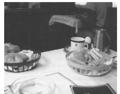
Mitropa ist der DB AG-Spitze ebenso nicht mehr zeitgemäß wie andere eisenbahntypische Begrifflichkeiten.