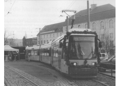
Niederflur-Straßenbahn: Zweirichtungs-Variante.