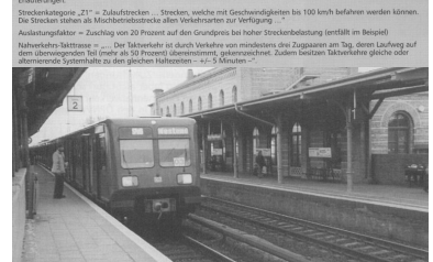
Bahnhof Königs Wusterhausen: Hier beginnt die Strecke nach Frankfurt/Oder über Beeskow.