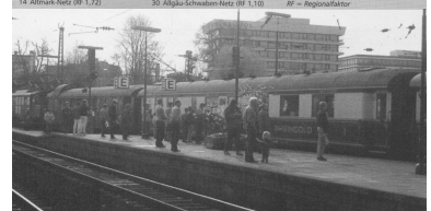
Der Wettbewerb darf sich nicht nur auf Sonderzüge und Sonderfahrten beziehen. Wenn die Deutsche Bahn tatsächlich Wettbewerb zulassen will, darf sie Wettbewerber nicht diskriminieren. (Foto: Rheingold-Sonderzug in Bonn Hbf, DBV-Archiv)