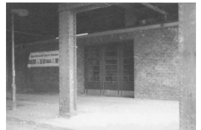
Juli 2002