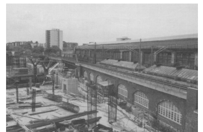
Juli 2000