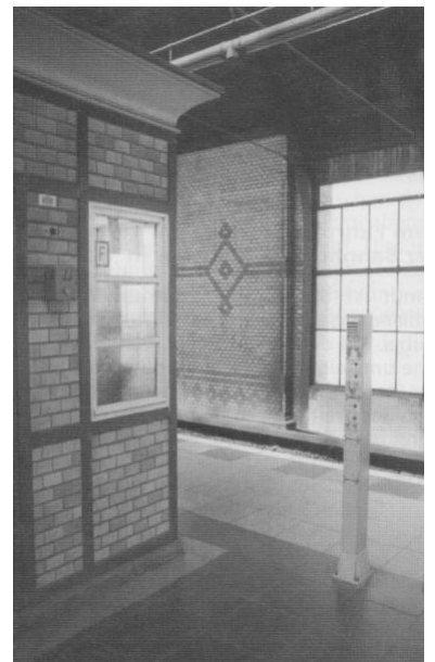
April 2002