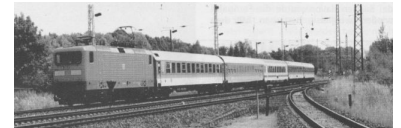
Deutlich reduziert ist seit dem 16. Juni 2002 das Angebot auf der Interregio-Linie 34 durch den Wegfall fast aller Verbindungen im Abschnitt Magdeburg - Berlin. Die Aufnahme zeigt IR 2274 in Blankenfelde.