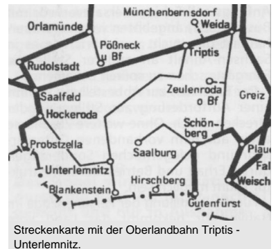
Streckenkarte mit der Oberlandbahn Triptis - Unterlemnitz.