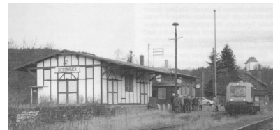
DRE-Inspektionsfahrt auf der Oberlandbahn.