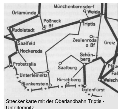
Streckenkarte mit der Oberlandbahn Triptis - Unterlemnitz.