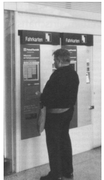
Fahrkartenkauf am Automaten.