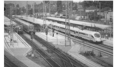
Züge mit und ohne Plan & Spar, mit und ohne Wochenendbindung, mit und ohne Reservierung, aber alle mit Bahncard, mit und ohne Kontingentierung. Das zeichnet das einfachere Tarifsystem der Deutschen Bahn AG ab 15. Dezember 2002 aus. (Foto: Fern- und Regionalzüge im Bahnhof Bamberg)

Auch gibt es weitere Rabatte, die jedermann ohne Bedingungen in Anspruch nehmen kann: Mitfahrer- und Bahncard-Rabatt.