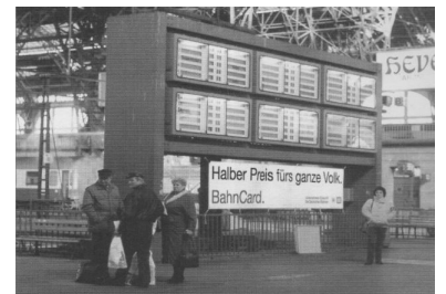
Statt halbem Preis für das Volk gibt es ab 15. Dezember nur noch 1/4-Preis für halbe Volk. Und wer Glück hat, bekommt bei seiner Fahrt über 180 Kilometer auch einen der kontingentierten 40 Prozent-Plätze. Für alle anderen wirds halt teurer.