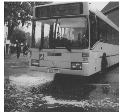
Endlich auch in Buch jetzt Berliner Busstandard!