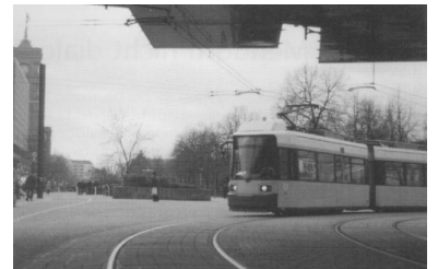
Noch geht es unter der Bahnbrücke am Bahnhof Alexanderplatz nur um die Kurve. Im Bildhintergrund, dort, wo die Betonkübel stehen, soll die Strecke weiter zum Roten Rathaus (links am Bildrand) gehen.