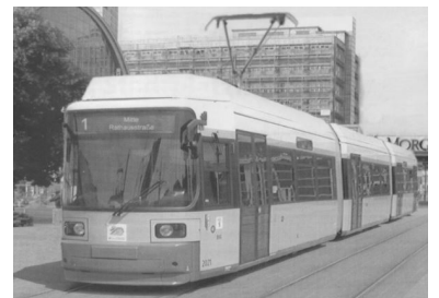
So könnte es einmal aussehen: ein Straßenbahn-Zug fährt zur neuen Endstelle Rathausstraße. Links die Halle des Bahnhofs Alexanderplatz, die letzten Stockwerke des Alexanderhauses sind auch noch sichtbar.