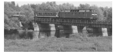
Regionalbahn von Kostrzyn nach Berlin-Lichtenberg auf der Odervorortbrücke.