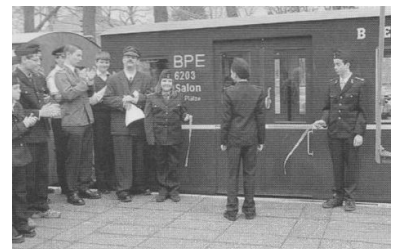
Einsteigen bitte heißt es wieder bei der Berliner Parkeisenbahn. Die zahlreiche Spiel- und Freizeiteinrichtungen in der Wuhlheide laden Alt und Jung zum Besuch und zum Verweilen ein. Den Salonwagen (unten im Bild) kann man sogar mieten!