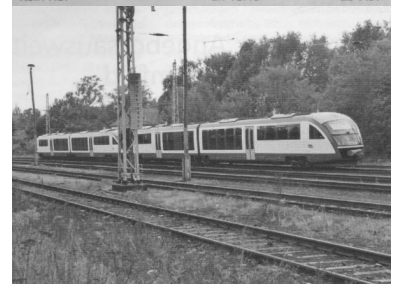
Das Angebot wurde leider eingeschränkt. Die Interconnex-Verbindung Cottbus - Berlin - Stralsund wird seit dem 1. Mai 2003 nur von Freitag bis Montag angeboten. (Foto: Interconnex im Bahnhof Königs Wusterhausen; Christian Schultz)