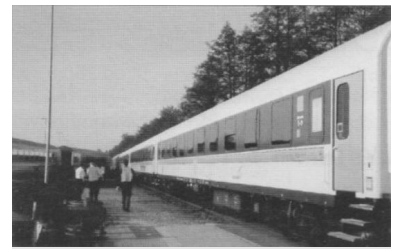
Neuer Reisezugwagen

Reisende bis zum vollendeten 26. Lebensjahr erhalten rund 30 Prozent Ermäßigung, Kinder bis zum vollendeten 6. Lebensjahr fahren kostenlos. Eine