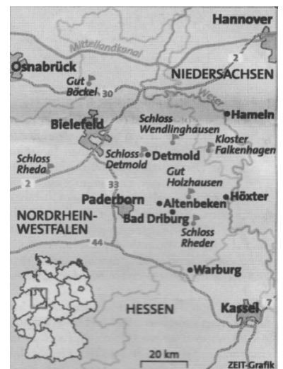
Hannover ist über die A 2 und den Mittellandkanal erreichbar. (Zeichnung: Die Zeit)