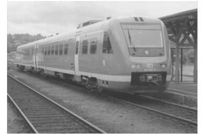
Nahverkehrszug nach Bad Brambach - mit EgroNet-Tarif!

Aus Ihren Einsendungen sowie aus den Vorschlägen der DBV-Mitgliedsorganisationen hat der Bundesverbandsrat des DBV am 2. August 2003 die Preisträger 2003 gewählt, die wir Ihnen nachstehend bekannt geben: - Bahnpreis: Usedomer Bäderbahn GmbH, Seebad Heringsdorf, Bürger- und Vereinspreis: Bündnis »Die Bahn bleibt«, Salzwedel, Europapreis: Zweckverband ÖPNV Vogtland, Auerbach (Vogtl), Innovationspreis: DB Reise & Touristik AG, Frankfurt /Main, Kulturpreis: DB Regionetz Infrastruktur GmbH - Oberweißbacher Berg- und Schwarzatalbahn, Mellenbach-Glasbach, Medienpreis: Südwestrundfunk, Baden-Baden.