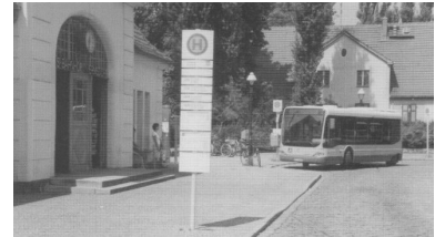
Die neue Kiez-Buslinie 326 am S-Bahnhof Hermsdorf.

Und wie wichtig eine solche Beteiligung der Betroffenen im Vorfeld von geplanten Linienänderungen ist, zeigt sich am Beispiel der Buslinie 142 sehr deutlich. Was die BVG in ihrem Infoblättchen »BVG-Plus" positiv unter der Schlagzeile »Ohne Zickzack durch Friedrichshain" verkaufte, hatte tatsächlich den Alltag für viele Fahrgastgruppen in nicht akzeptabler Form verändert. Die Einstellung der Buslinie 142, die nur abschnittsweise durch die Buslinie 140 bzw. die neue Buslinie 347 ersetzt wurde, ist eben nicht dadurch zu rechtfertigen, dass man den Kreuzbergern eine bessere Fahrmöglichkeit mit der Buslinie 140 zum Rathaus Friedrichshain bietet.