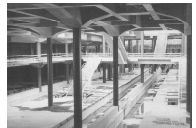
Baustelle Berlin Hauptbahnhof - Lehrter Bahnhof.