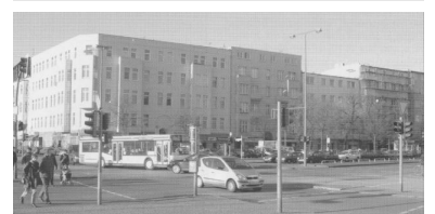
S-Bahn-Ersatzverkehr per Bus zwischen Charlottenburg und Zoologischer Garten. Trotz häufiger Fahrten ist das nur die zweitbeste Lösung, zumal die Fahrzeit sich ab 6. Januar 2004 verlängern wird, wenn die Busse zum Bahnhofseingang an der Gervinusstraße fahren müssen.