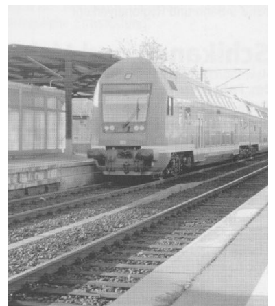
Endstation Charlottenburg für die RB 10 aus Nauen. Ab 14. Dezember 2003 werden noch weniger Züge als bisher zum Bahnhof Friedrichstraße durchgebunden.