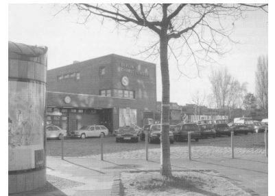
Es kommt noch schlimmer! Am 6. Januar 2004 wird als Folge der Bauarbeiten der Zugang durch das Empfangsgebäude des Bahnhofs Charlottenburg vorübergehend geschlossen. Das Umsteigen zur U 7 ist damit praktisch nicht mehr möglich.

Um nun die Bahn in die Knie zu zwingen, entschied Verkehrssenator Peter Strieder,