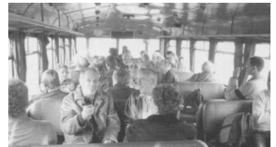
Wegen geringer Nachfrage bestellte das Land Brandenburg die RB 50 Rathenow - Neustadt (Dosse) zum 1. Dezember 2003 ab. (Foto: Florian Müller, 15. November 2003)