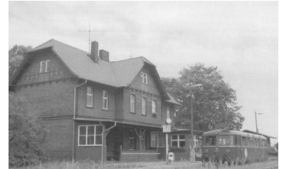
Auch im Bahnhof Rhinow hält, wenn dieses Heft erscheint, bereits kein Zug mehr.