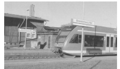
Seit Mitte Dezember 2003 fährt kein Zug mehr von Brandenburg nach Belzig.

Das Desinteresse des DB-Konzerns gipfelte in der Einstellung des Schienenverkehrs auf dieser Strecke zum 1. Dezember 2000 mit der Begründung, ein sicherer