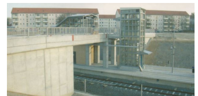
Das Umfeld des neuen S-Bahnhofes wird durch reines Wohnen geprägt. Aber die Stadt Teltow ist weiterhin interessiert, einen Investor für ein Geschäftsgebäude am Bahnhof zu gewinnen.