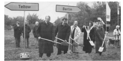
Spatenstich für die S-Bahn-Neubaustrecke nach Teltow im Oktober 2003 an der Landesgrenze zwischen Brandenburg und Berlin.

Die Abstimmung und Vorbereitung der Gesamtmaßnahme lag bis 1999 in den Händen des damaligen Ministeriums für Stadtentwicklung, Wohnen und Verkehr (MSWV) des Landes Brandenburg. Diese Aufgabe hat die Stadt Teltow im Frühjahr 2000 federführend übernommen und in Zusammenarbeit mit complan seitdem über 30