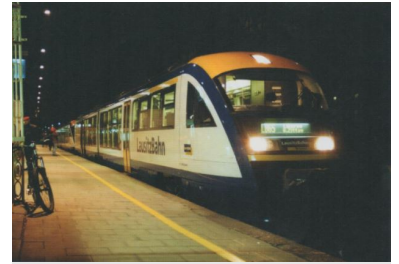
Vorletzte Fahrt des X 88157 am 10. Dezember 2004 von Stralsund über Berlin-Lichtenberg nach Liberec um 19.45 Uhr im Bf Görlitz (2 VT Desiro der LausitzBahn, hinterer VT wird in Görlitz abgehängt).

Die Zeitlage des InterConnex Zugpaares war zwar für die Oberlausitzer sehr attraktiv, da die morgendliche Hinfahrt (Ankunft vor 9 Uhr in Berlin-Lichtenberg) und nachmittägliche Rückfahrt (Abfahrt 16.53 Uhr) ausgedehnte Tagesbesuche in der Bundeshauptstadt ermöglichte. Auch für Wochenendpendler aus der von hoher