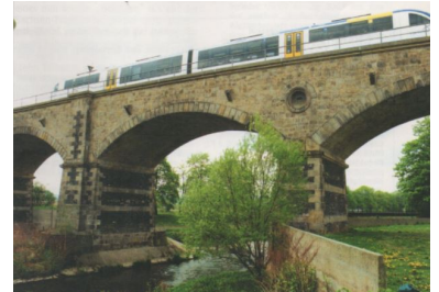
Sonderfahrt von Connex zu den Feierlichkeiten der EU-Erweiterung am 1. Mai 2004 von Zittau nach Liberec: Aus diesem Pendelverkehr wurde ab 4. Juni 2004 eine regelmäßige Verlängerung des InterConnex von Binz nach Liberec. Stand am Zittauer Weißeufer, Blick Richtung Polen auf das Weißviadukt.