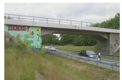
Tschüß! Der Abschiedsgruß für die Besucher der Landesgartenschau 2006 gilt nun auch der Bahn zum Nordbahnhof. In den letzten Jahren wurden drei neue Brücken für die Sanierungsstrecke Rathenow--Rathenow Nord erbaut. Aber nun soll auf den 3,5 Kilometern kein Zug mehr fahren, beschloß kurzfristig der Brandenburgische Verkehrsminister. Was sagt der Rechnungshof dazu?