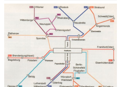
Netz der Regionalexpress-Linien in Brandenburg, die über Berlin geführt werden, ab 28. Mai 2006. (Grafik: MIR Brandenburg, Stand 10. Mai 2005)