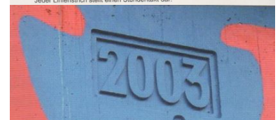
Oben und rechts: Erst 2003 erbaut und schon stillgelegt - die Brücke über die B 188 in Rathenow