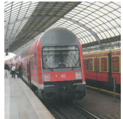
Brandenburg zahlt: Deshalb fährt der Prignitzexpress wenigstens noch nach Spandau und die RB 10 stündlich nach Charlottenburg.

Damit ist die Anbindung des Havellandes nicht mehr so gut wie bisher - aber das noch vor einem Monat befürchtete Horrorszenario der Abkoppelung Falkensees von der Stadtbahn ist glücklicherweise vom Tisch. Minister Szymanski benutzte die eigenwillige Formulierung »Der Bahnhof Spandau bekommt eine größere Bedeutung.« Denn hier ist nun häufiger Umsteigen angesagt als bisher. Den Fahrgästen in den heute gut gefüllten Zügen wird das nicht gefallen. Hier sollte bei Bedarf flexibel mit einer Angebotsausweitung seitens des Bestellers reagiert werden, bis man eines Tages hoffentlich mit der S-Bahn von Falkensee nach Berlin fahren kann (s. SIGNAL 2/2005 )!