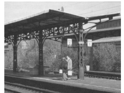
Der Bahnhof Frankfurt-Mainkur soll aufgegeben und durch einen neuen Tunnelbahnhof ersetzt werden.