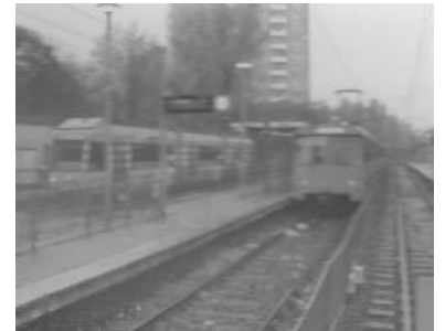
In Ginnheim enden U-Bahn und Straßenbahn. Die U-Bahn soll demnächst die Straßenbahn in die Frankfurter Innenstadt ersetzen.