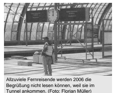
Allzuviele Fernreisende werden 2006 die Begrüßung nicht lesen können, weil sie im Tunnel ankommen.