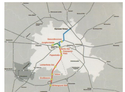
Neue Strecken und neue Bahnhöfe für den Fern- und Regionalverkehr im Raum Berlin ab 28. Mai 2006 (Grafik: DB AG)