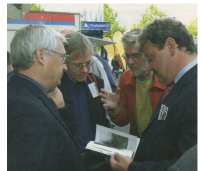
VBB-Chef Hans-Werner Franz (links) und Brandenburgs Verkehrsminister Frank Szymanski (rechts) besuchten am »Tag für die Fahrgäste« auch den Stand des Berliner Fahrgastverbandes IGEB am 17. September am Bahnhof Friedrichstraße.