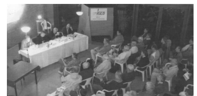
Ein Schwerpunkt der IGEB-Öffentlichkeitsarbeit ist die Mitwirkung an den jährlichen Schienenverkehrs-Wochen. Auf Einladung des Berliner Fahrgastverbandes kamen auch dieses Jahr führende Vertreter der