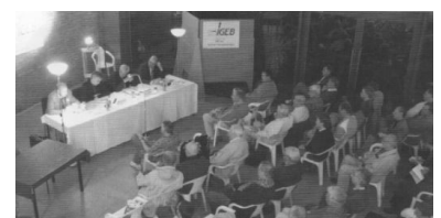
Ein Schwerpunkt der IGEB-Öffentlichkeitsarbeit ist die Mitwirkung an den jährlichen Schienenverkehrs-Wochen. Auf Einladung des Berliner Fahrgastverbandes kamen auch dieses Jahr führende Vertreter der