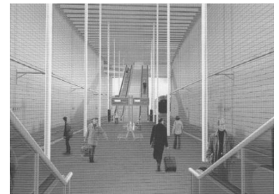
So soll die Tunnelstation Markt aussehen.

Können durch den Tunnel mit seiner besseren Erschließung der Innenstadt (es geht hier in der Regel um 15-minütige Fußwege) tatsächlich in Größenordnungen neue Fahrgäste für die Bahn gewonnen werden? Leipzig ist ohne Frage ein aufstrebendes Wirtschaftszentrum, aber wohin sollen die Fahrgäste fahren? Die meisten