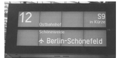
Modern. In Berlin Hauptbahnhof-Lehrter Bahnhof und Papestraße sind LCD-Anzeiger in Betrieb. Die Ausführung mit zwei Anzeigeflächen ist für Fernbahnhöfe vorgesehen. S-Bahnhöfe sollen Anzeiger mit nur einer Anzeigefläche bekommen. Die Gleisnummer soll künftig nicht mehr im Display angezeigt werden, dafür die Halteposition am Bahnsteig.