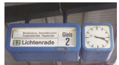
Beliebt. Diese Fallblattzugzielanzeiger sind bei der Berliner S-Bahn sehr verbreitet. Weil sie nicht mit dem neuen »Reisenden-Informationssystem" der DB kompatibel sind, werden sie abgebaut.