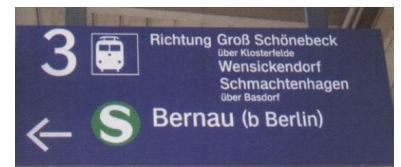
Sparsam. Bahnhöfe an Außenstrecken will die DB nur noch mit Blechschildern bestücken. Wenn, wie in Karow, 116 Züge zu sieben verschiedenen Zielen verkehren, ist ein einfaches Schild nicht ausreichend.