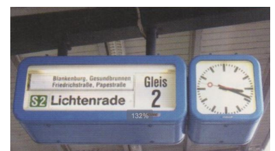
Beliebt. Diese Fallblattzugzielanzeiger sind bei der Berliner S-Bahn sehr verbreitet. Weil sie nicht mit dem neuen »Reisenden-Informationssystem" der DB kompatibel sind, werden sie abgebaut.