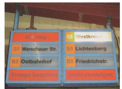
Seit Jahrzehnten bewährt. Leuchtkästen, auch Transparentzugzielanzeiger genannt, sind mit Glühlampentechnik offenbar zu einfach für eine moderne Bahn AG. Da sie nicht computerkompatibel sind, sollen sie durch Blechschilder ersetzt werden.