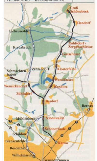
Streckennetz der Heidekrautbahn 2006. Dunkel die betriebenen Strecken, hell ohne Personenverkehr. (Zeichnung: Sven Tombrink (NEB), Kartengrundlage aus dem Buch 100 Jahre Heidekrautbahn, DNV, München, 2001)