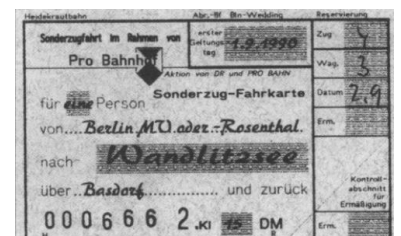
Fahrkarte einer Heidekrautbahn-Sonderfahrt. Bald nach dem Mauer fall und noch vor der Wiedervereinigung wurden im Rahmen der 7. Berliner Schienenverkehrs-Wochen die ersten Sonderfahrten zum Grenzbahnhof Märkisches Viertel durchgeführt.