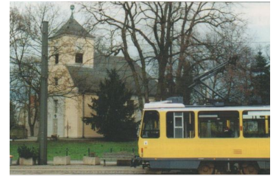
Die Schmöckwitzer Uferbahn, befahren von der Linie 68, ist eine der schönsten Straßenbahnstrecken Deutschlands. Ihr Potenzial als Ausflugs- und Touristenstrecke wird von der BVG nicht ausreichend vermarktet.

Schließlich wäre es gar nicht möglich, einen Bus die Strecke der Straßenbahn befahren zu lassen, es sei denn, man würde den Bereich Regattastraße und die Trasse durch den Wald für einen Bus ausbauen, was hoffentlich selbst die autofixiertesten Berliner Verkehrsplaner nicht ernsthaft erwägen.