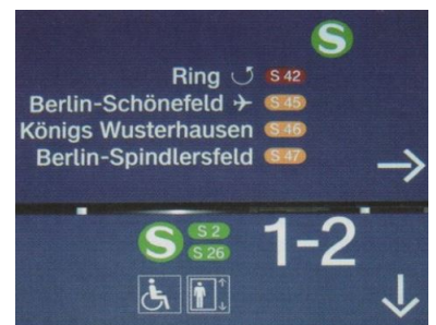
Fünf S-Bahnlinien - zwei davon falsch: Auf allen Schildern wurden die Fahrgäste noch wochenlang auf die seit dem Fahrplanwechsel Ende Mai nicht mehr verkehrende Linie S 45 zum Flughafen Schönefeld hingewiesen. Und statt der S 26 fährt längst die S 25.