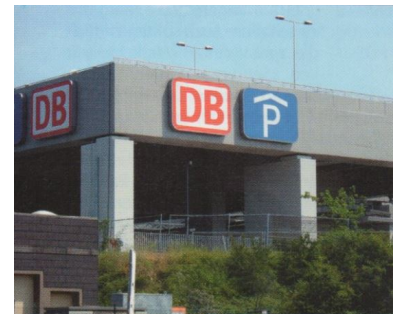
So »ansprechend« präsentiert sich der Bahnhof Südkreuz zum Sachsendamm hin. Immerhin: Diese Beschilderung weist keine Fehler auf.

Während der östliche Vorplatz, der wegen einer nachträglichen Änderung des Planfeststellungsbeschlusses zugunsten eines Zugangs in der -1-Ebene und den daraus resultierenden Treppen und Rampen als Platz kaum nutzbar sein wird, bisher noch nicht fertig gestellt ist, kann der ebenfalls missratene westliche Vorplatz bereits genutzt werden. Ob hier die Architekten, die Bahn oder die Akteure bei Senat und Bezirk versagt haben, kann dahingestellt bleiben. Wohl um die zentrale Sichtachse auf