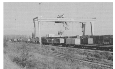
Umschlagbahnhof Großbeeren: Nach der Schließung des Terminals HuL hat er endlich neue Aufgaben bekommen (Foto: Christian Schultz, Dezember 2003)