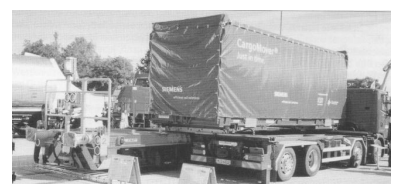
Vom Lkw auf den Güterwagen und umgekehrt. Die Umschlagtechnik »Mobiler« macht es möglich