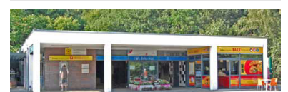
Empfangsgebäude Britz-Süd. Der Bäckereiladen