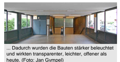
... Dadurch wurden die Bauten stärker beleuchtet und wirkten transparenter, leichter, offener als heute.