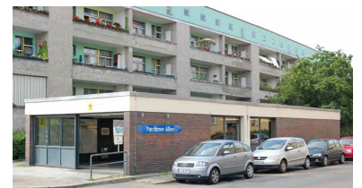
Das südliche Empfangsgebäude der Station Parchimer Allee vor einer Hauszeile der Hufeisensiedlung. Die Front wie die seitlichen Fenster besaßen ursprünglich große, fast bis zum Boden reichende Scheiben. ...