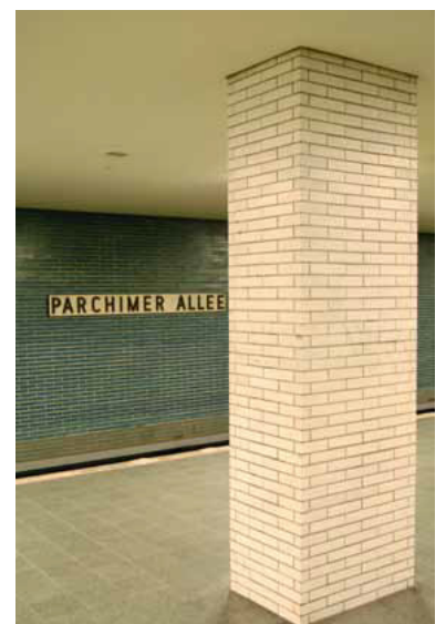
Gerade Linien, rechte Winkel.