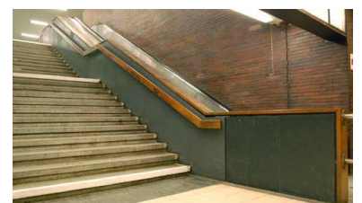
Rustikale Anmutung: Im südlichen Treppenhaus des U-Bahnhofs Britz-Süd findet sich auch nach der Sanierung der Station neben Klinkern Holz.