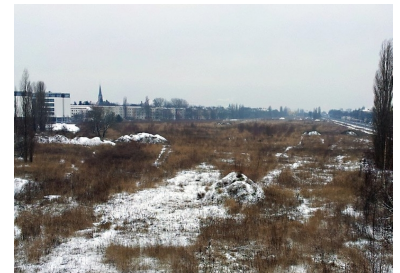
Auf dieser großen Brachfläche ist ein ganzer Stadtteil geplant, der einen Straßenbahnanschluss benötigt.