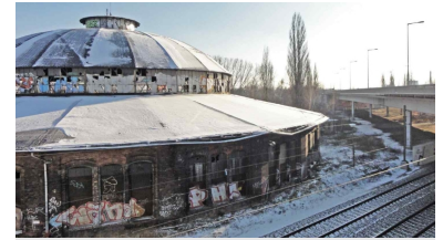
Noch aus den Zeiten des Rangierbahnhofs stammt der alte Lokschuppen. Er soll Aula einer neuen Oberschule werden. Rechts unter der Brücke am S-Bf Pankow-Heinersdorf ist viel Platz für eine Straßenbahntrasse mit großzügiger Haltestellenanlage.