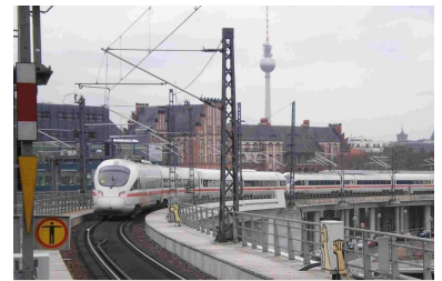
Die Berliner Stadtbahn ist, abgesehen von der S-Bahn, mit Fern- und Regionalbahnlinien hoch ausgelastet. DB Netz muss deshalb nun einen Plan zur Erhöhung der Schienenwegkapazität erstellen.

Es wäre für viele Bahnkunden nun allerdings mit erheblichen Nachteilen verbunden, wenn die Kapazitätsengpässe auf der Stadtbahn zum Anlass genommen werden sollten, Züge des Fernverkehrs weitgehend, im Extremfall sogar komplett in den Nord-Süd-Tunnel zu verbannen. Mit dieser bereits seit längerem diskutierten Lösung würde der speziell für die östlichen Bezirke wichtige Halt Berlin Ostbahnhof vom Fernverkehr abgehängt. Das kann und darf nicht das Ziel sein!