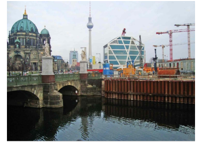
Hier unter dem Wasser des Kupfergrabens soll der neue U-Bahnhof Museumsinsel entstehen. Der Schildvortrieb steht derzeit wegen zu hohem Wassereintritts in die Bahnhofsbaustelle still, bevor er das Flussbett unterquert. Links die Schloßbrücke und der Berliner Dom, in der Mitte der Fernsehturm und die temporäre Humboldt-Box, rechts der Rohbau des neuen Berliner Stadtschlösses/Humboldtforums. (Foto: Florian Müller, Mitte Januar 2014)

Die Auswirkungen auf den Fertigstellungstermin, zuletzt geplant für Ende 2019, und auf die Gesamtkosten sind noch nicht absehbar. Allein die Fortschreibung der Kostenrechnung mit aktuellen Zahlen ergab ein Risiko von etwa 100 Millionen Euro. So geht die BVG derzeit (noch ohne Berücksichtigung der Mehrkosten durch den Wassereintritt) davon aus, dass der 2,2 km lange Tunnelbau statt geplanter 433 Mio nun 525 Mio Euro kosten wird. Da der Gesamtetat für den Bahnbau nicht steigt, wird das für die U 5 zusätzlich benötigte Geld für andere Ausbauprojekte schmerzlich vermisst werden - insbesondere beim Straßenbahnneubau. (ge)