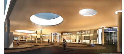
Der weite Dachüberstand mit Glaskuppeln schützt vor Regen. Darunter werden zwei Pavillons errichtet.