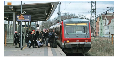
RB 66 in Angermünde vor der Abfahrt nach Stettin. Eingesetzt werden die Züge der alten Baureihe 628, oft nur in Einfachtraktion. Bei erhöhtem Fahrgastandrang, regelmäßig beispielsweise vor Weihnachten, sind die Züge extrem überfüllt. Teilweise kommen nicht einmal alle Fahrgäste mit.